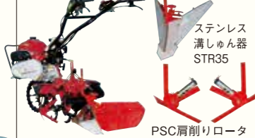
ステンレス 溝しゅん器 STR35