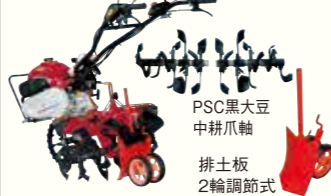
PSC黒大豆 中耕爪軸 排土板 2輪調節式