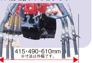
415・490・610mm ※寸法は外幅です。

作物が大きくなって、うね間作業がしづらくなれば、ノンツールでハンドル幅を狭くできます。