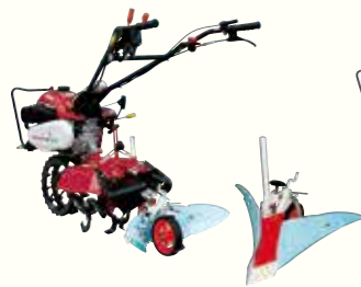
ミニアポロ培土器Bプラス