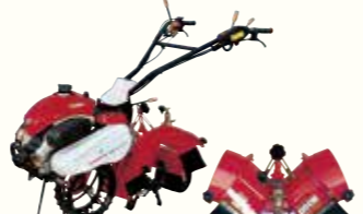
麦土入れロータリー